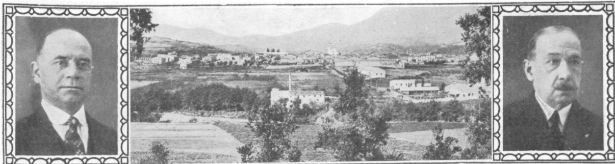
Esteban Brunell Aymar Alcalde